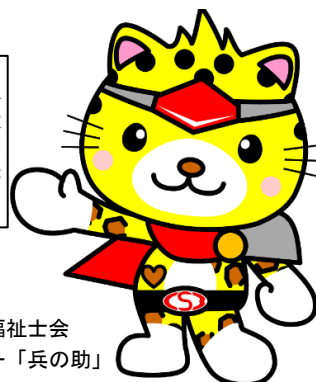
兵庫県社会福祉士会 キャラクター「兵の助」